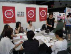
整理収納アドバイザー 養成講座