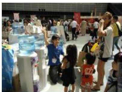
株式会社アクアクラレモン 様