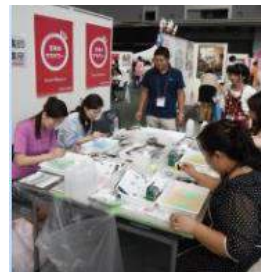
マーブリング養成講座