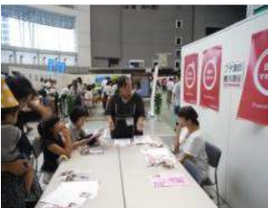
花育プチ養成講座