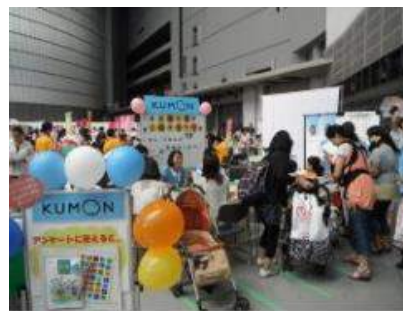
日本公文教育研究会 様