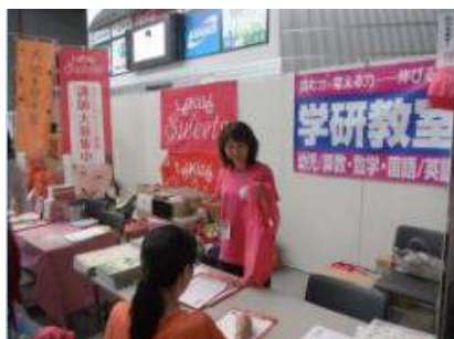
株式会社学研エデュケーショナル 様