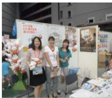
ミサワホーム西関東株式会社 様