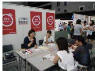
サンキャッチャーカラー セラピスト養成体験講座