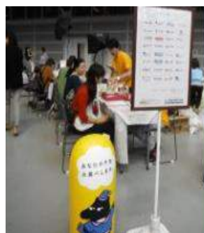
保険オンライン 様