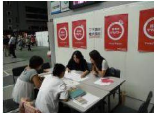
風水プチ講師養成講座