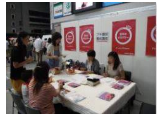
キッズパートナーブル コデイナー養成講座