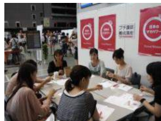
メディカルアロマセルフケア セラピスト養成入門講座