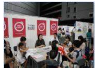
おやこじてんしゃ勉強会

プチ講師養成講座は、フェスタの原点でもある 「被災地支援イベント」から始まった、 ママに講師体験をして一歩踏み出してもらうための講座。 各講座とも事前申込で、早々に満員になるほどの人気です。