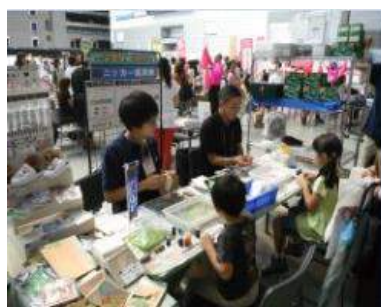
ニッカー絵具株式会社 様