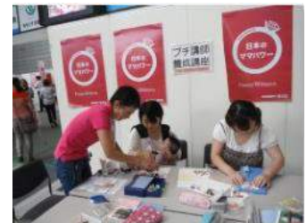
スクラップブックの 「プレ体験養成講座」養成講座

プチ講師養成講座は、フェスタの原点でもある 「被災地支援イベント」から始まった、 ママに講師体験をして一歩踏み出してもらうための講座。 各講座とも事前申込で、早々に満員になるほどの人気です。