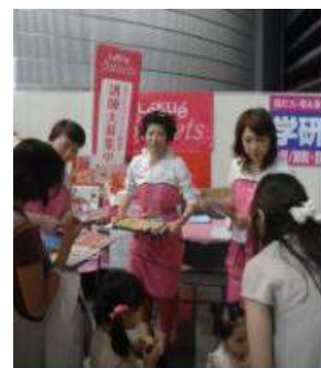
株式会社 THREE ルクエスイーツ協会様

たくさんママ&パパを応援している企業・団体にご協力いただきました。 当フェスタは、企業のサポートを受け開催しています